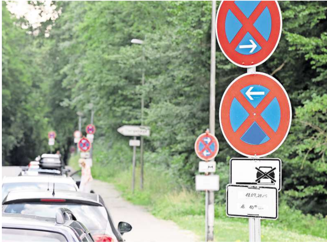
Temporäres Halteverbot in der Sauerbruchstraße: Heute finden Arbeiten an dem dortigen Sendemast statt. Sie sollen bis Mittwoch abgeschlossen sein.